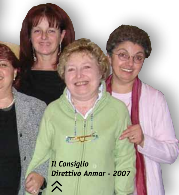
Il Consiglio Direttivo Anmar - 2007