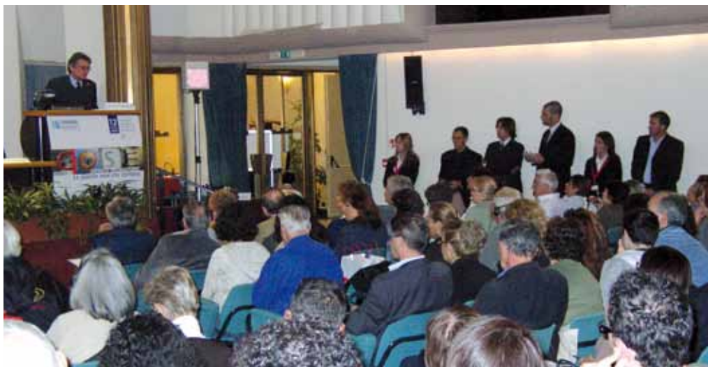
» Convegno Artrite Reumatoide. Le piccole cose che contano - 2007 Nelle due foto a sinistra: Stand Anmar alla Sir di Palermo - 2003